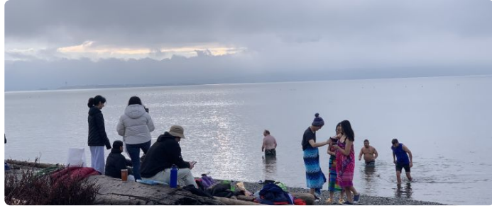
有人已经下水，不少小女孩。