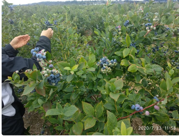
蓝莓园采摘蓝莓，摘了后称重交钱。