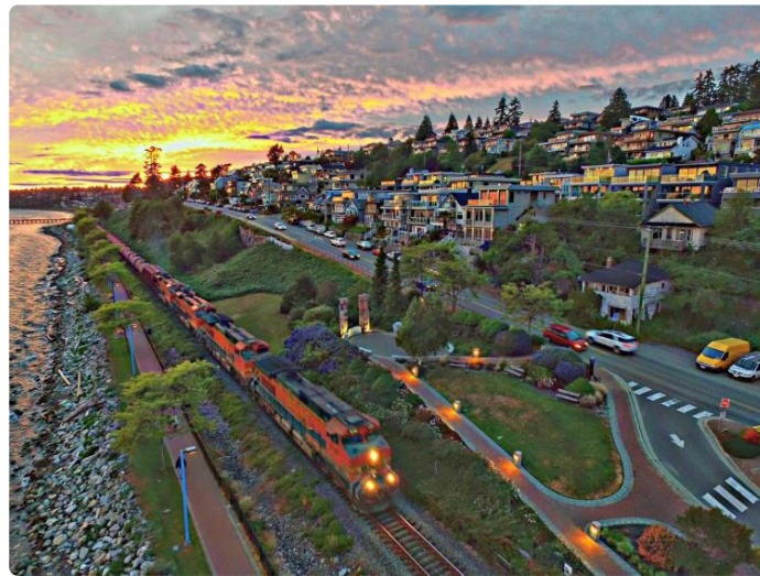
白石的西端一角。在晚霞映射下，海水，门窗都泛出红光。再配合灯光，尤其是在这个当口有火车开过。火车也是红色的，开着红灯，一片绮丽无比的夜晚景观。