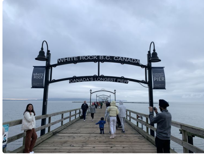
加拿大最长的栈桥。