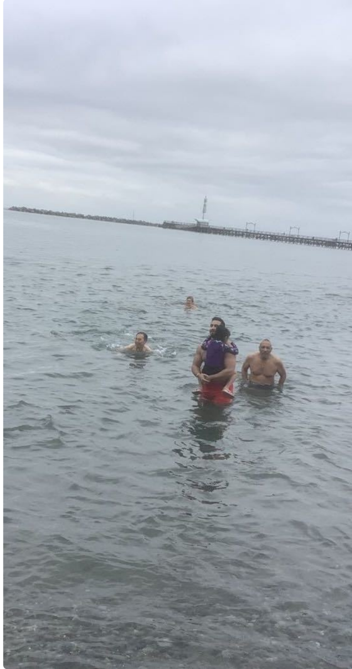
开始下水了，最左边的人是本尊。