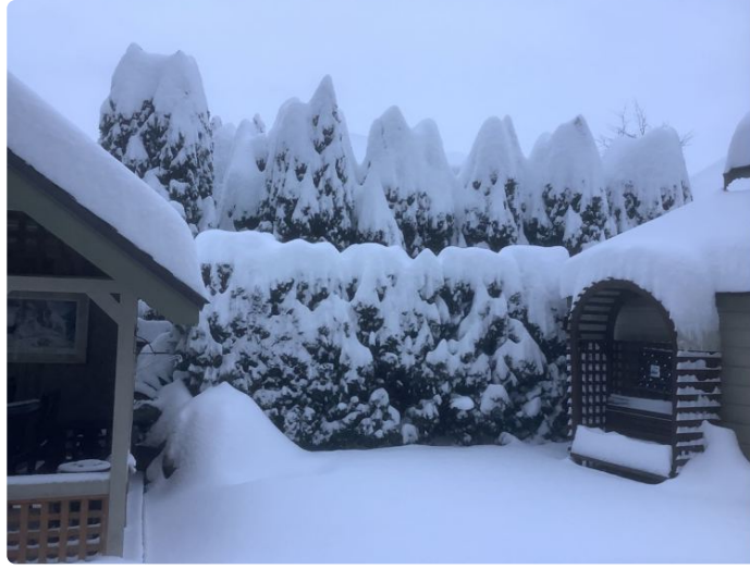
松树已经是一身白衣白帽。