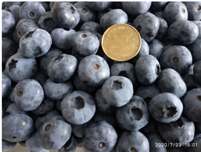
蓝莓也很大，跟一元硬币差不多。