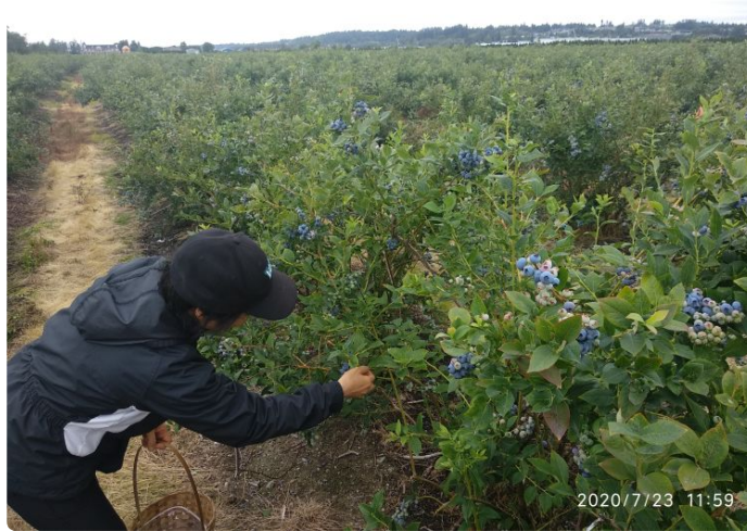
蓝莓园很大，边走边摘。