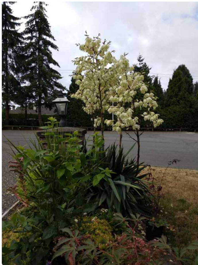
剑麻干茎笔直粗壮，就像一棵树。